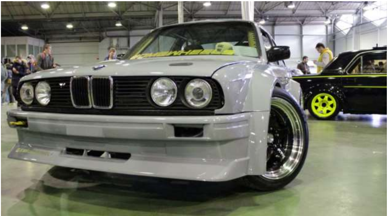
BMW E30 – широкие шины и арки, каркас безопасности, замки капота.