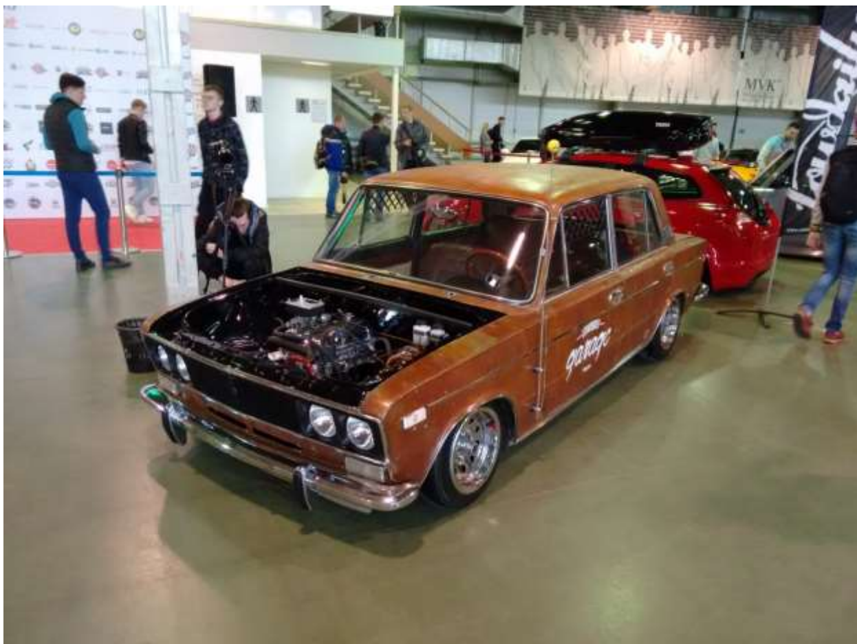
ВАЗ-2106 родом из СССР