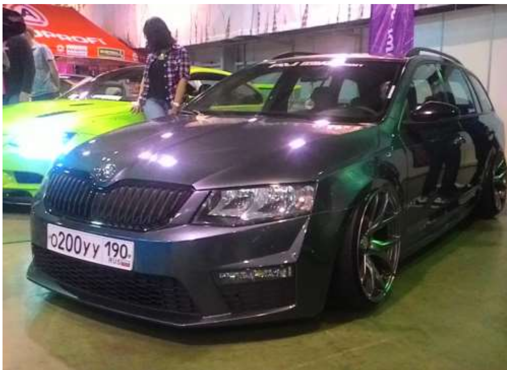
Scoda Octavia Combi

Рядом были представлены ателые по установке пневмоподвески. Интересно, сколько стоит комплект вместе с установкой? – от 150 до 400 тысяч рублей в зависимости от класса автомобиля. – ответили в Power Wheels.