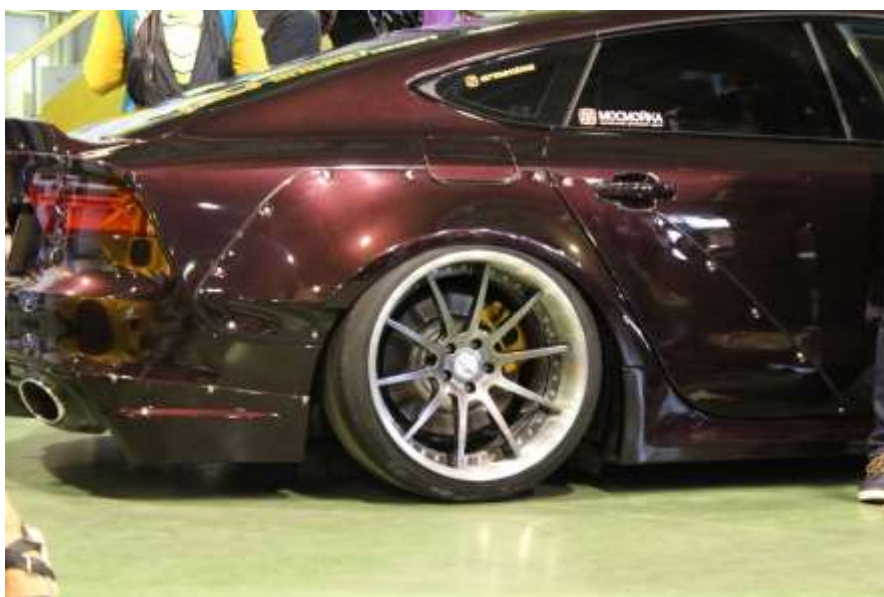
Вышеупомянутый Audi A7 от Power Wheels

Удалось увидеть варианты доработки стандартных атмосферных моторов путем установки турбокомпрессора.