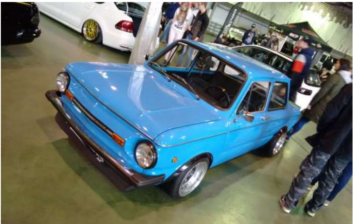
Легенда советского автопрома – ЗАЗ-968М