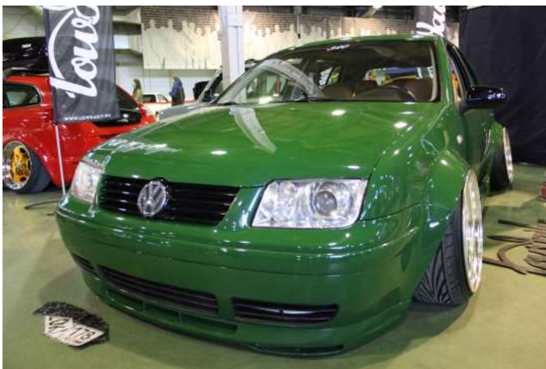
Volkswagen Bora «Stance»