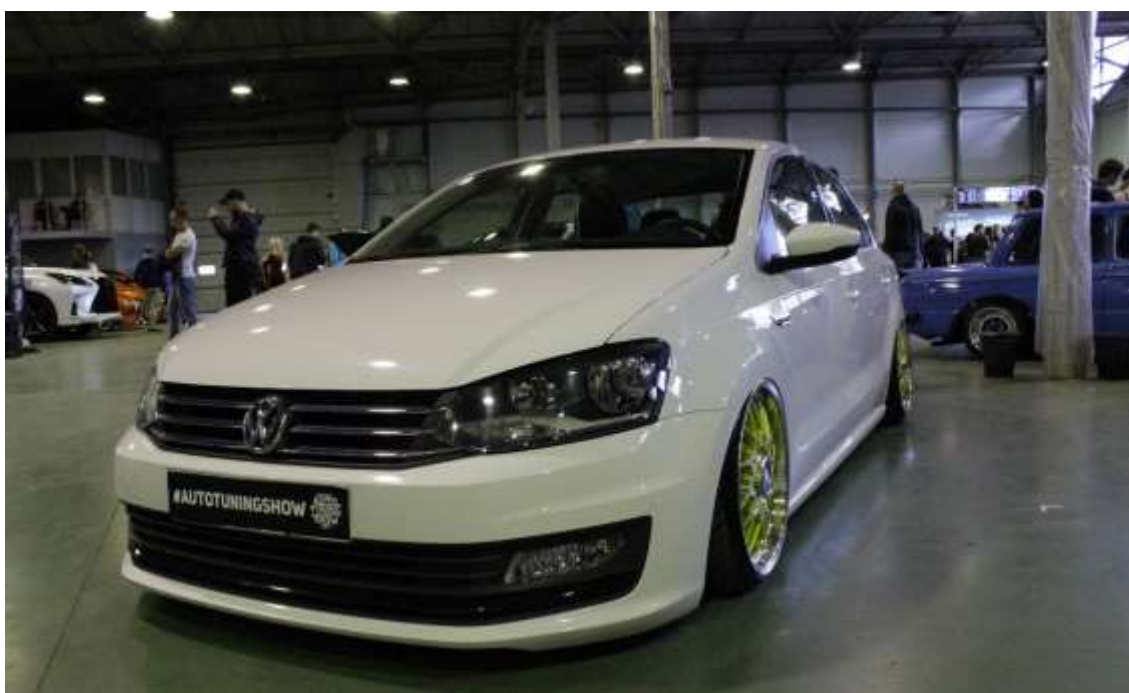
Volkswagen Polo седан